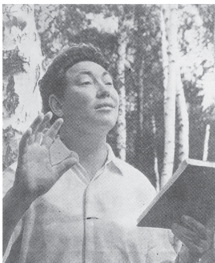
Рис. 3. Поэт-манси Юван Шесталов