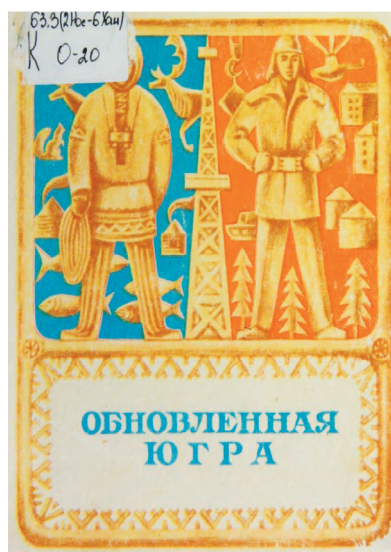
Рис. 2. Обложка юбилейного сборника «Обновлённая Югра. К 40-летию Ханты-Мансийского национального округа» (Средне-Уральское книжное издательство, Свердловск, 1970).

Если в 1951 г. абстрактный образ промышленного гиганта был подан на заднем плане, на переднем «братскую семью народов» олицетворял оленевод, приветствующий новую эпоху, то в 1970 г. на плоскости по обе стороны от нефтяной вышки разместились фигуры оленевода и строителя-монтажника, показанные в соответствующем антураже. Вышка может «читаться» и как разделяющая, и как объединившая мир этнической традиции и промышленно-строительного бума. Этничность представлена здесь тынзяном, орнаментом на одежде оленевода и в обрамлении заголовка 1 , перекликающимся с «орнаментом» рисунка металлических конструкций вышки; «обновление» дано не только изображениями многоэтажных домов, нефтяных цистерн, подъёмного крана,