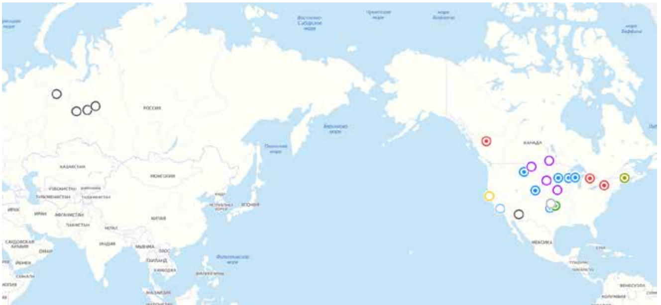
Рис. 3. Карта распространения игры «Снежная змея».