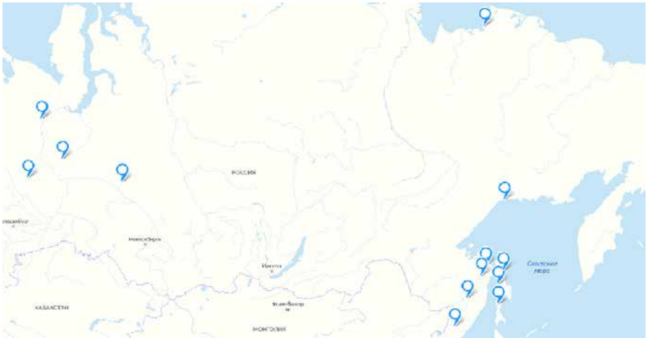
Рис. 4. Карта распространения игр с большим количеством палочек.

Амура ещё 3 дополнительных варианта [14, 61–65, 97–100], 4 варианта у ульчей [14, 122–124], а также у нанайцев [14, 150], удэгейцев [14, 228–231], ороков [14, 284–285] и айнов [13, 70–72]. Юкагиры подбрасывали 20–25 палочек и ловили тыльной стороной руки оговоренное количество [7, 21; 18, 20]. А. Н. Фролова приводит эвенкийскую игру в палочки «Обалакан» [16, 86]. У китайцев и японцев описана игра с пятью камешка-