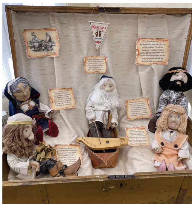
Рис. 5. Экспозиционный зал «Эпос Калевала» в Этнокультурном центре «КАЛЕВАЛАТАЛО» (фрагмент)

В центре «КАЛЕВАЛАТАЛО» завершающий зал этнографической экспозиции посвящён эпосу «Калевала». В его основу легли руны – народные эпические песни, большая часть которых была записана Элиасом Лённротом (1802–1884) 1 в Карелии. В музейном пространстве эпос представлен с помощью кукол-персонажей (Вяйнямёйнен, Илмаринен, Лоухи и др.), изготовленных местными мастерицами (см. рис. 5). Помимо героев эпоса в экспозиции отражена биографическая информация о местных жителях-сказителях, рунопевцах. Посетители могут обратиться к рунам вживую с помощью аудиозаписей и в представленной научно-публицистической литературе, рукописных тетрадах. Кроме того, в музее хранится целая коллекция музыкальных инструментов для исполнения рун – кантеле. Стоит отметить, что нить эпоса проведена через все залы этнокультурного центра. Так, в «Мужском» пространстве предметно-вещевые коллекции дополнены иллюстрациями ключевых персонажей: в разделе охоты изображён образ Лемминкяйнена, в кузнечном деле – Илмаринена, кисти Н. Кочергина. В перспективе сотрудники центра планируют расширить интерактивный слой этнографической экспозиции, делая тематический упор на рунопение, эпос – визуализация сочетания рун на карельском,