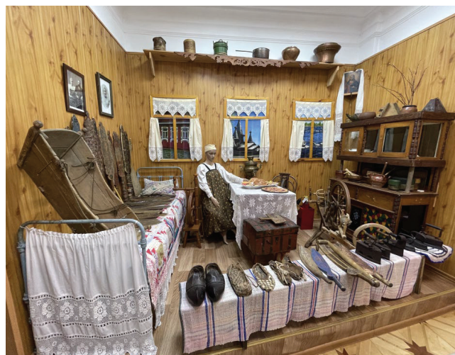
Рис. 2. Экспозиционный зал «Поморская горница» в Кемском краеведческом музее «Поморье» (фрагмент)

Материальная культура состоит из созданных или приобретённых человеком вещественных средств жизнедеятельности: жилище с утварью и интерьером, хозяйственные постройки, одежда, транспорт, пищевые продукты, орудия труда [3, 22]. Как правило, материальная сфера культуры является самой распространённой и разнообразной для показа в музейных пространствах. Так, в музее «Поморье» тема жилища с утварью и интерьером раскрывается в экспозиционном зале «Поморская горница», в котором расположилась стилизованная комната дома поморов. Помимо интерьера в экспозиции раскрываются и занятия поморских женок: выставлены коллекции прялок, утюгов, рубелей, кухонной утвари и муляжи традиционной выпечки (см. рис. 2). В уже упомянутом зале «Море – наше поле» помимо экологической сферы показана и неразрывно связанная с ней материальная через демонстрацию традиционных занятий поморов. Условно зал можно разделить на несколько подтем: морской промысел, кузнечное дело,