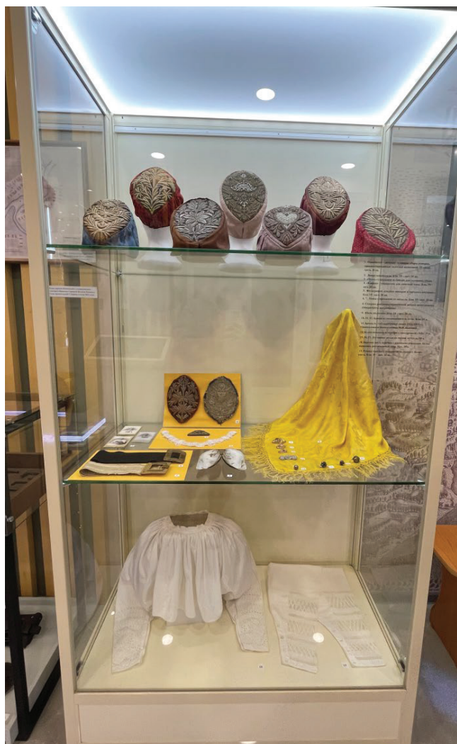
Рис. 4. Экспозиция Беломорского краеведческого музея (фрагмент)

В Беломорском краеведческом музее авторы концепции этнографической экспозиции старались относиться максимально корректно к презентации духовной сферы этнической культуры. Опасались, например, трудных диалогов с посетителями на тему старообрядчества. Изначально одна из витрин задумывалась для презентации коллекции старопечатных церковных книг, но в последствии сотрудники музея заменили их на предметы рукоделия (повойники, орнаментированные золотой вышивкой; различные женские украшения и сорочки с вышивкой по выдергу белого цвета), тем самым создав яркий и привлекательный акцент в центре зала (см. рис. 4).