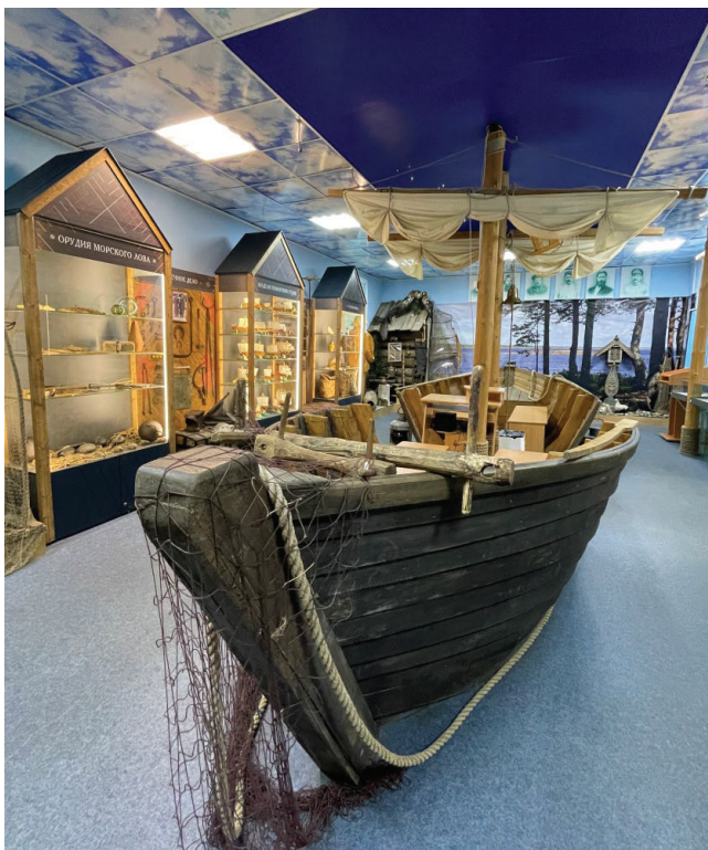
Рис. 1. Экспозиционный зал «Море – наше поле» в Кемском краеведческом музее «Поморье» (фрагмент)

развёрнуто показывается в специализированных «природных» залах, а в этнографической экспозиции тесно сплетается с показом традиционных занятий.